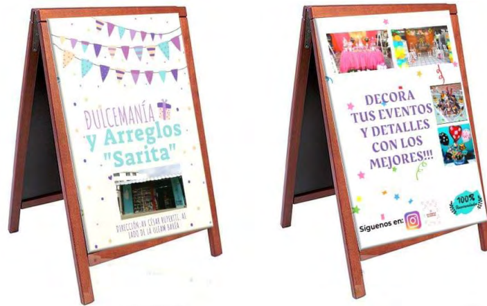
Figura 2. Parte trasera y frontal de Tipo paloma publicitaria.

La exposición constante de la valla tipo palomera en las afueras del local permitirá cautivar a los clientes actuales y potenciales de una forma más eficiente al entregar un mensaje oportuno con diseño creativo y alternativo, empleando imágenes en alta resolución, con un material adecuado y resistente a las condiciones, características de los espacios exteriores. Diseñado con contenido simple, conciso y convincente, pues, se debe captar la atención del transeúnte entre los 5 a 7 segundos de exposición.